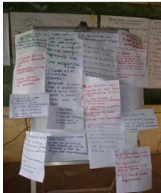
Cambios significativos de los Jóvenes Asamblea Flor de Pancasán

Algunos muestran orgullo de sus habilidades en la aplicación de técnicas de estimulación temprana con niños en las escuelas de sus comunidades: “Yo trabajé con la escuela de El Encanto y Comajón, en Apantillo” . “Nosotros trabajamos en nuestras propias escuelas 51 ” .